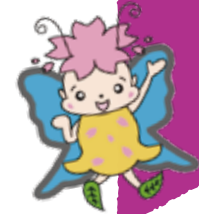
一真会マスコットキャラクター 花シス

8月 花むつみ フットケア研修 特養 かき氷祭り にしの杜 えがおプール(8/9・8/25・8/26) にしの杜 お盆前のお楽しみ会