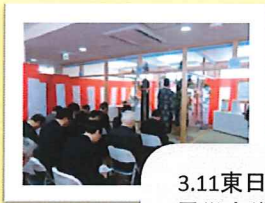
3.11東日本大震災直後でのオープンで竣工式も遅れて執り行われました