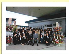
開設時職員記念写真 今も気持ちはイキイキ しています！