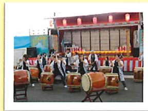
初めての花むつみ祭。 右往左往で大変だった面、達成感もひとしおです