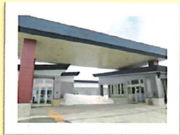
23年豪雪中の建設でした