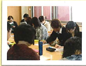
開設前研修。真剣な眼差しです！