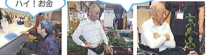
畑作りのプロに良い苗を選んでいただき、後日植えました