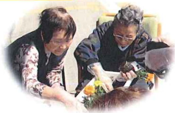
マリーゴールドを植えました