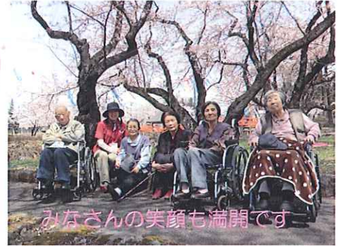
みなさんの笑顔も満開です