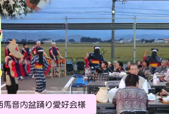
西馬音内盆踊り愛好会様