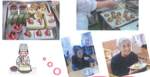
2月27日にパティシエが花むつみでケーキを作ってくれました。おやつに紅茶やコーヒーで美味しく頂きました♪