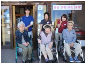
南部家敷でお食事