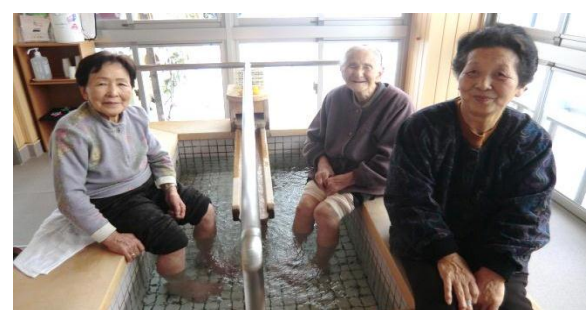
寒い冬は足湯で身も心もポカポカ