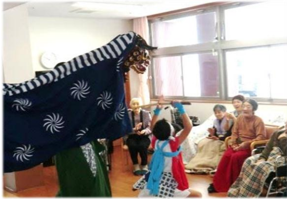
見事な剣の立ち振る舞い