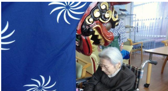
十文字・今泉地区の獅子の口割りで、一年の健康を祈願