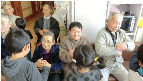
保育園児との交流会で手遊び