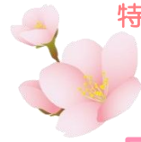
特別養護老人ホーム 花むつみ