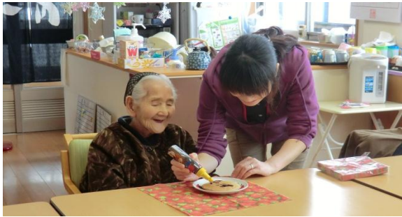
誕生日にはホットケーキにデコレーションでお祝い