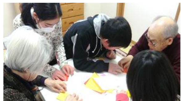
睦合小学校の児童と一緒に折り紙