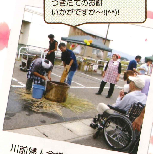
川前婦人会様による餅つき