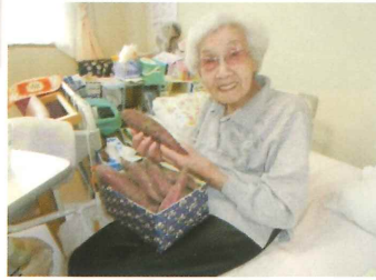
ザマイモ、おいそうね。