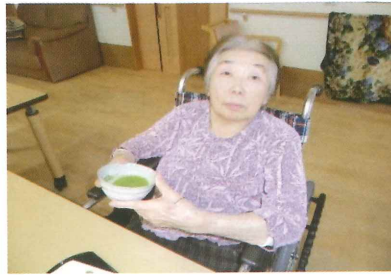
抹茶を立てて一息