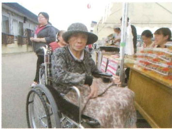
花むつみ祭で屋台に行きました。