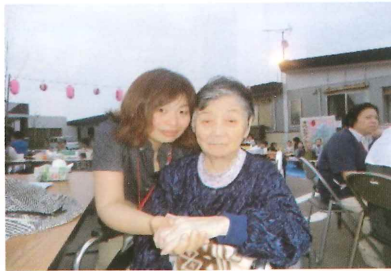
花むつみ祭でのひと時