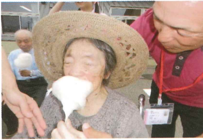
綿あめおいしいな！

花通りにお住まいの方々は、ご自分のペースで、日々のんびりゆっくりとお過ごしになられております。また花通りでは、お誕生日会や夏祭り、皆様と一緒に料理を作ったり、お菓子を作っております。作りたてのおいしさ、家庭らしさをこれからも花通りでは続けていきたいと思っております。皆様「あぁ、うめごと。」とお話しくださいました。皆様と笑顔は私たちスタッフの元気の源です。皆様と毎日を笑顔で過ごせるようにと思っております。