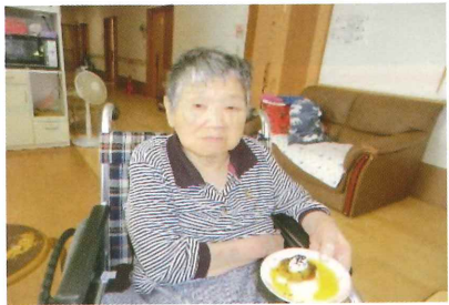
プリンを作りました！！