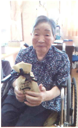
誕生日のプレゼントをもらいました。

皆さん、こんにちは。光通りです。花むつみの周りも、稲刈りが終わりました。すっかり秋の風景になりました。光通りでは、誕生日会や花むつみ祭、ユニットでのカラオケなどお住まいの方が楽しんで頂ける行事が行われました。お住まいの皆様は、とても声が素敵なお祝いをたくさん頂いて、笑顔がたくさん見られました。これから、寒くなつて参りますが、光通りの皆様がいっしょに笑顔でお過ごし頂きたいと思っております。