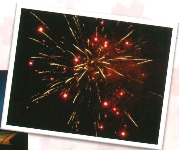
フィナーレの打上げ花火!!