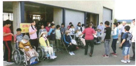
睦合小学校様、睦合保育所様と合同で避難訓練を行いました。