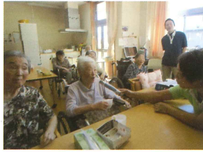
光通りのだ自慢開催です。