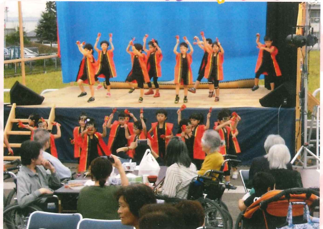
睦合保育所「元気っ子舞踊団」のみなさん