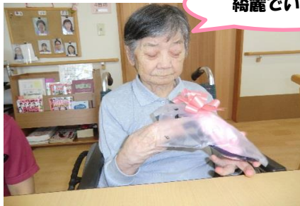
タオルもらいました