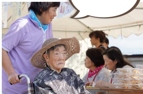
子どもワクワク体験教室