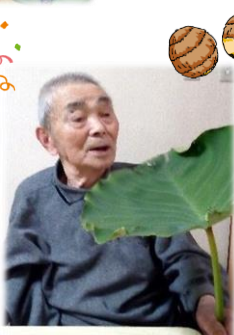
いものこがたくさん採れました