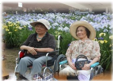
あやめ祭りへ出かけてきました