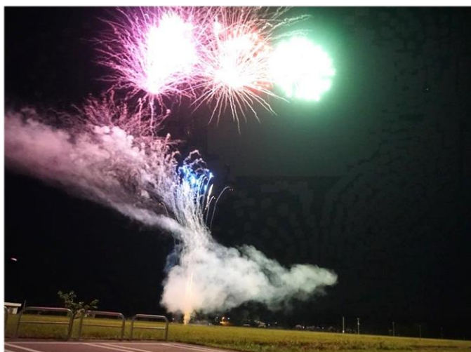
フィナーレの打上げ花火