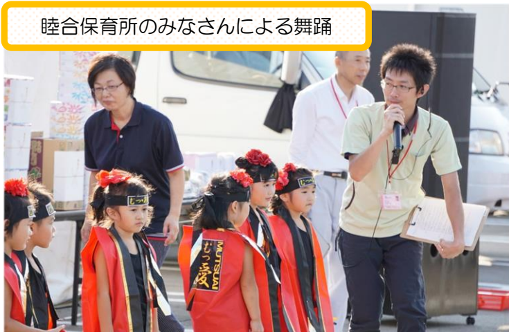
睦合保育所のみなさんによる舞踊