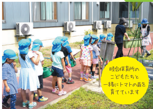
睦合保育所の 子どもたちと 一緒にトマトの苗を 育てています

6月1日。梅雨の季節となり、天候も心配でしたが、予定通り、ナスやきゅうりなどの夏野菜の苗植えを行いました。毎年恒例の行事である苗植えは、花むつみの敷地内にある『わえの畑』で、行なっています。参加した皆さんは、ご家庭で野菜をつくっていた方も多く、野菜づくりへの想いを感じられました。