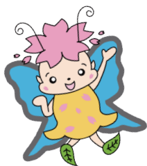
一真会 マスコットキャラクター 花シス