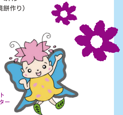
一真会 マスコット キャラクター 花シス