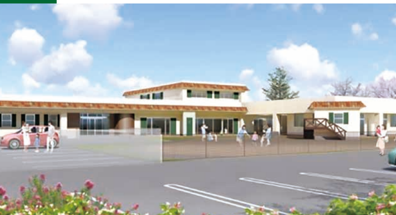
保育園建物完成イメージ