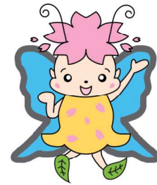
マスコットキャラクター