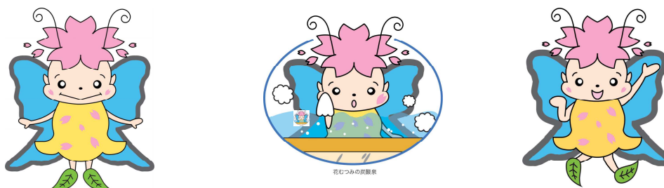
マスコットキャラクター

その他、マスコットキャラクター「花シス」も活用し、親しみやすい法人としての取組みを行っていく。